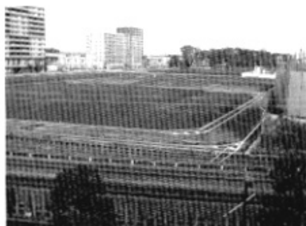
「宅鉄法」による整備事業により変地になった工場

市内の広い地域で緑が失われ、宅地として開発されてきたのは事実です。しかし、 流山市はこの状況を黙って見ているわけではありません。 市では「流山グリーンチェーン戦略」を始めとした緑化施策を進め、新たに造成された住宅地や市街地にもたくさんの緑が整備されるような仕組みを作っています。また行政が主導の政策だけでなく、市民、企業、市が連携して緑の都市づくりに取り組んでいるという大きな特徴があります。