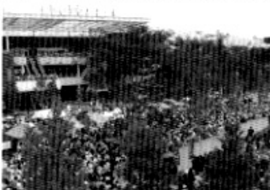
大勢の人でにぎわうグリーンフェスティバル

「都心から一番近い森のまち」をアピールするために、毎年ゴールデンウィークに流山おおたかの森駅南口都市広場を中心に「グリーンフェスティバル」を開催しています。