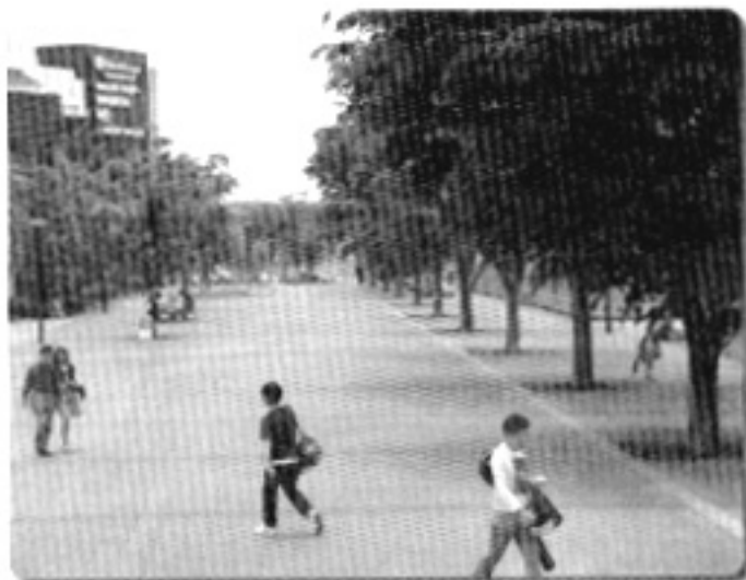
高木が並ぶ流山おおたかの森駅南口都市広場