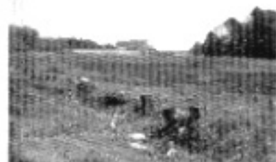
森林保護後のイメージ