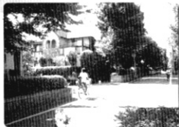
緑陰の美しい住宅街