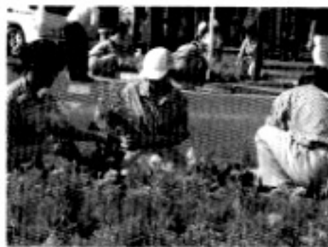
花を植えるボランティアの皆さん

市では、花と緑のボランティアを随時募集しています。ボランティア登録者には、活動のサポートとして市で保険加入をさせていただきます。また、登録者を対象にした花に関する講習会も実施しています。