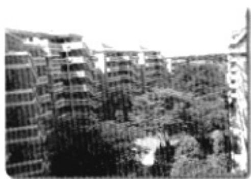
緑の多い集合住宅