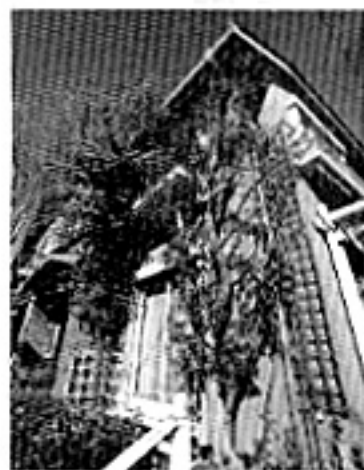
高い樹木を植えることで外壁の温度上昇を防ぐとともに、窓から緑を眺めることができる

「流山グリーンチェーン戦略」は、市民、企業、市が連携して、点の緑を線に、そして面として市全体に広げていこうという取り組みです。では、それぞれの家や建物では、具体的にどんなことをすればよいのでしょうか？